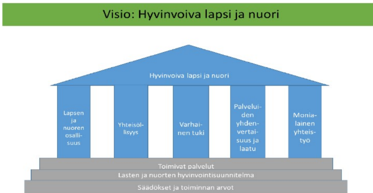
BILD 2. Stöd för barn och ungas välbefinnande

Elevvården definieras i lagstiftningen och i läroplansgrunderna. Den ska vara enhetlig och i linje med den lagstadgade välfärdsplanen för barn och ungdomar. För att eleverna ska få de tjänster inom elevvården som de behöver ska tjänsterna vara fungerande. Målet med verksamheten är välmående barn och unga.