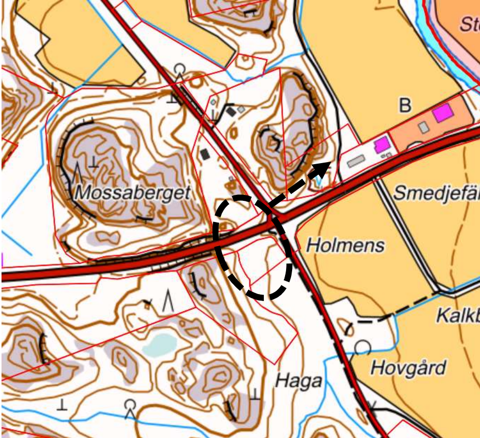
Suunnittelualueen likimääräinen sijainti sekä tutkittava jalankulun/pyöräilyn yhteystarve.

Alue on valtion ja yksityisten maanomistajien omistuksessa.