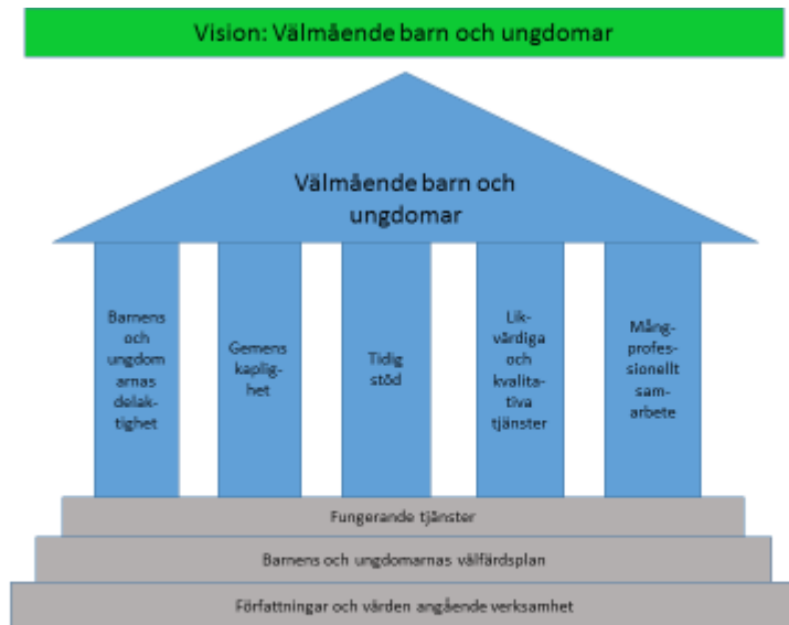
BILD 2. Stöd för barnens och ungdomars välbefinnande

Elefvården definieras i lagstiftningen och i grunderna för läroplanen. Den ska vara enhetlig och i linje med den lagstadgade välfärdsplanen för barn och ungdomar. För att eleverna ska få de tjänster inom elevvården som de behöver ska tjänsterna vara fungerande. Målet med verksamheten är välmående barn och unga.