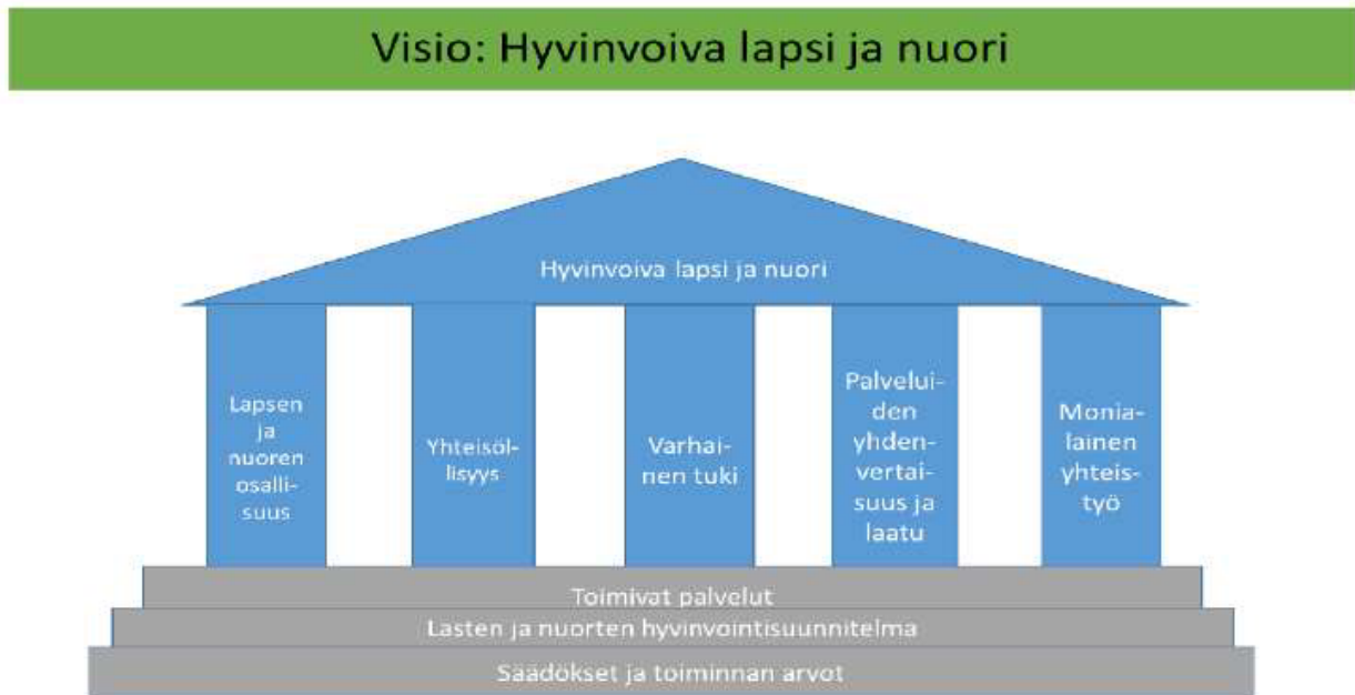
KUVIO 2. Lasten ja nuorten hyvinvoinnin tukeminen

Opiskeluhoito määritellään lainsäädännössä ja opetussuunnitelmien perusteissa. Sen tulee olla yhteneväinen ja linjassa lakisääteisen Lasten ja nuorten hyvinvointisuunnitelman kanssa. Jotta oppilaat saavat tarpeidensa mukaiset opiskeluhoollolliset palvelut, niiden on oltava toimivia. Toiminnan tavoitteena on hyvinvoiva lapsi ja nuori.