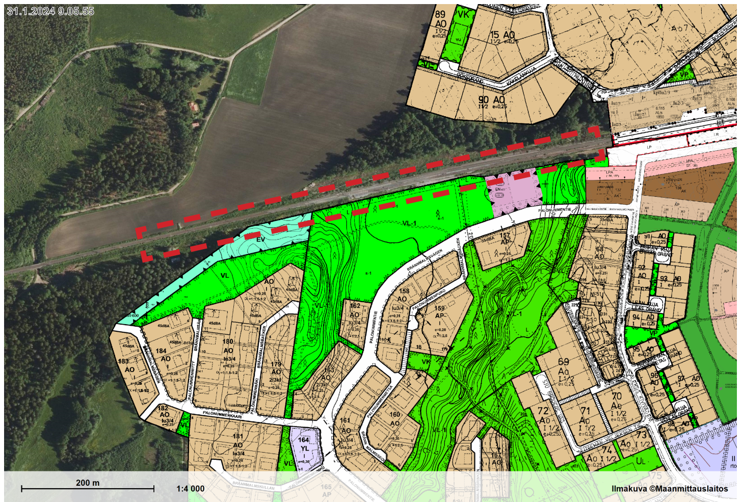
Kuva/Bild: Ote asemakaavatilanteesta. Alustava asemakaavan suunnittelualueen raja- aus punaisella. / Utdrag ur detaljplansituationen. Preliminär avgränsning av planeringsområdet markerad med rött.

Detaljplaner i Sjundeå kartservice: https://kartta.siuntio.fi/link/oXLxE