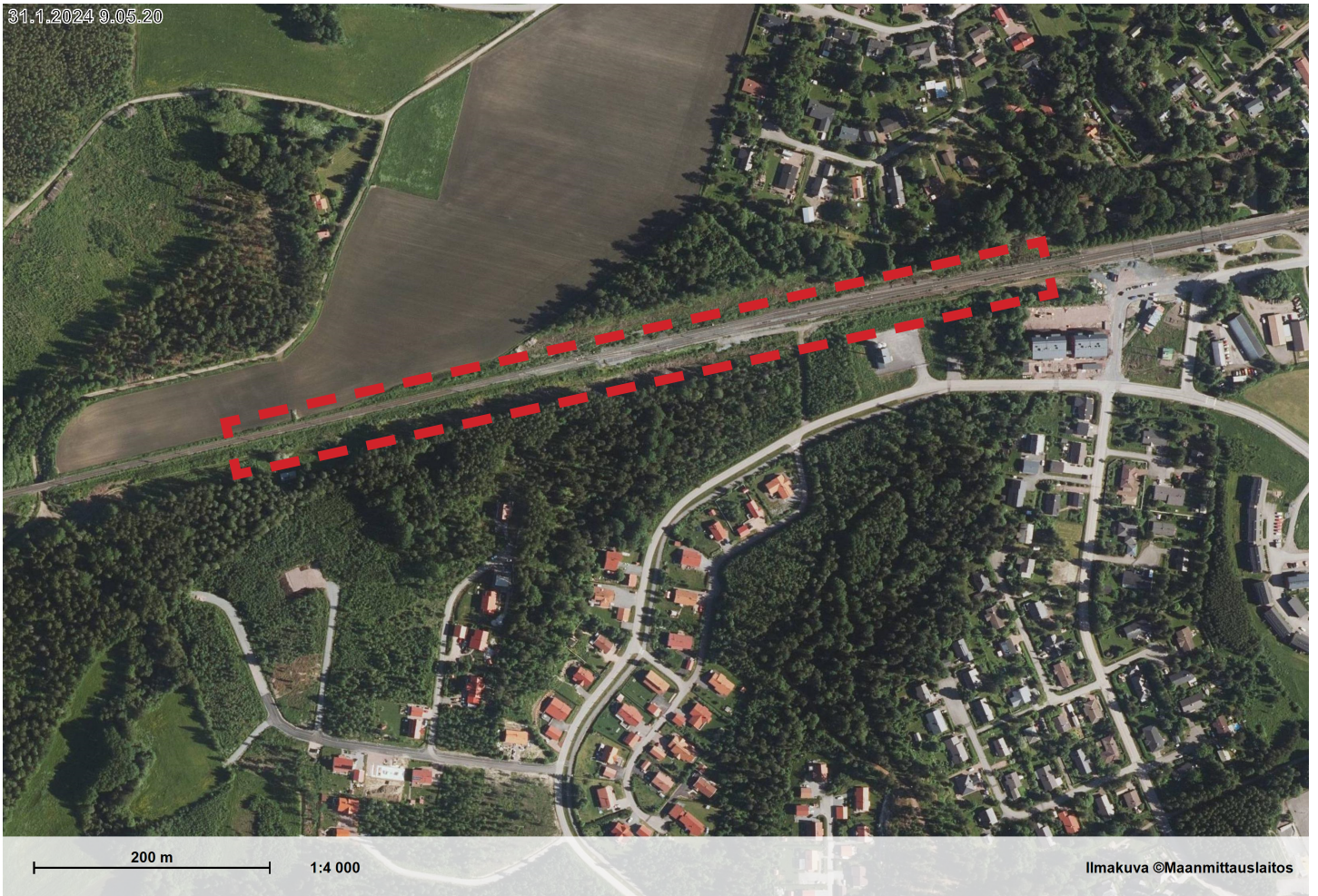
Kuva/Bild: Alustava suunnittelualan rajaus. / Preliminär avgränsning av planeringsområdet. 6.2.2024.