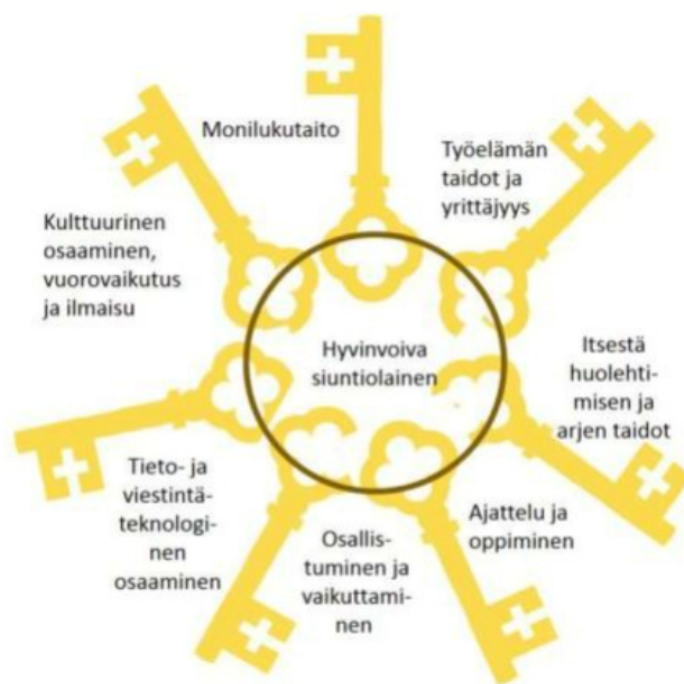
Kuva 1. Hyvän elämän avaimet