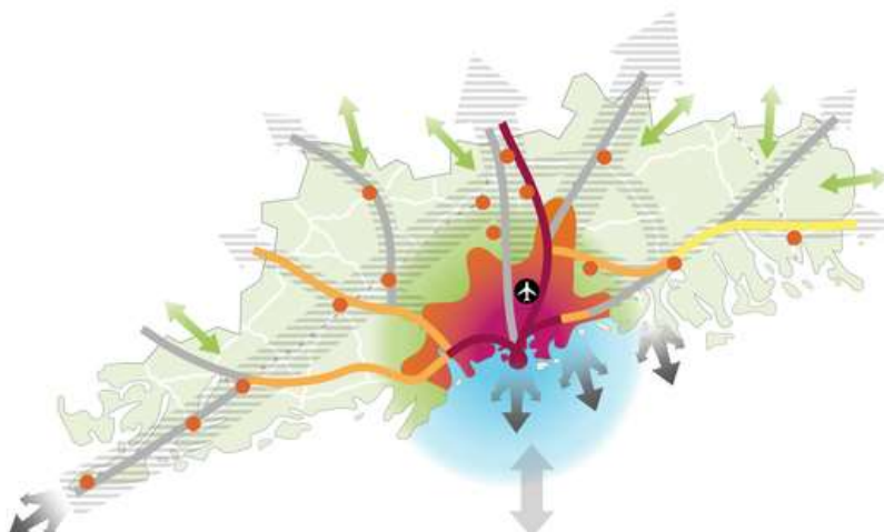
Kuva: Uudenmaan alueen rakennesuunnitelma (oikeusvaikutukseton) esittää kokonaiskuvan aluerakenteesta vuonna 2050.