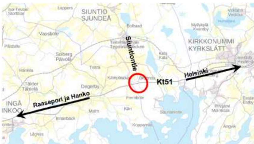
Kuva/Bild: Kaava-alueen likimääräinen sijainti punaisella ympyrällä. Det ungefärliga läget för det område som ska detaljplaneras. (Karta/Karta: Maanmittauslaitos/ Lantmäteriverket 2017)

Asemakaavan suunnittelualue jaetaan pienempiin alueosiin tarvittaessa. Suunnittelussa hyödynnetään Siuntion portin yleissuunnitelmaa (kh 21.6.2021 § 173).